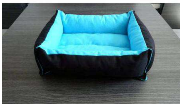
Modèle de dodos