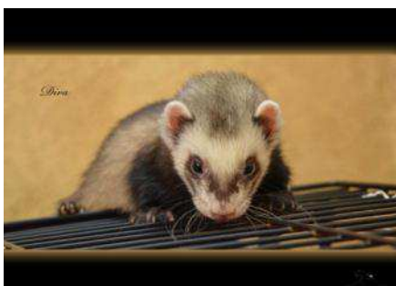
Diva et Milka

Nous sommes très heureux de vous annoncer l'adoption de :